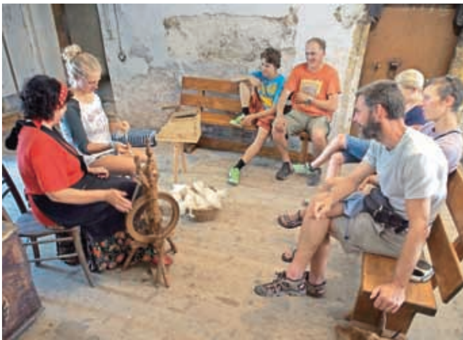
Ob Mijinem kolovratu

Petkov večer pohodniškega festivala s sedaj že tradicionalno izvedbo treh kratkih zgodb iz knjige Jezerske štorije je že napovedoval naše letošnje poletno dogajanje, ki ga prav po knjigi imenujemo Jezerska štorija. Kot že preteklo leto smo tudi letos pripravili dvome-sečno dogajanje s ponavljajočimi se tedenskimi dogodki. Ob ponedeljkih ste se ob Primoževem vodstvu podučili o foto-