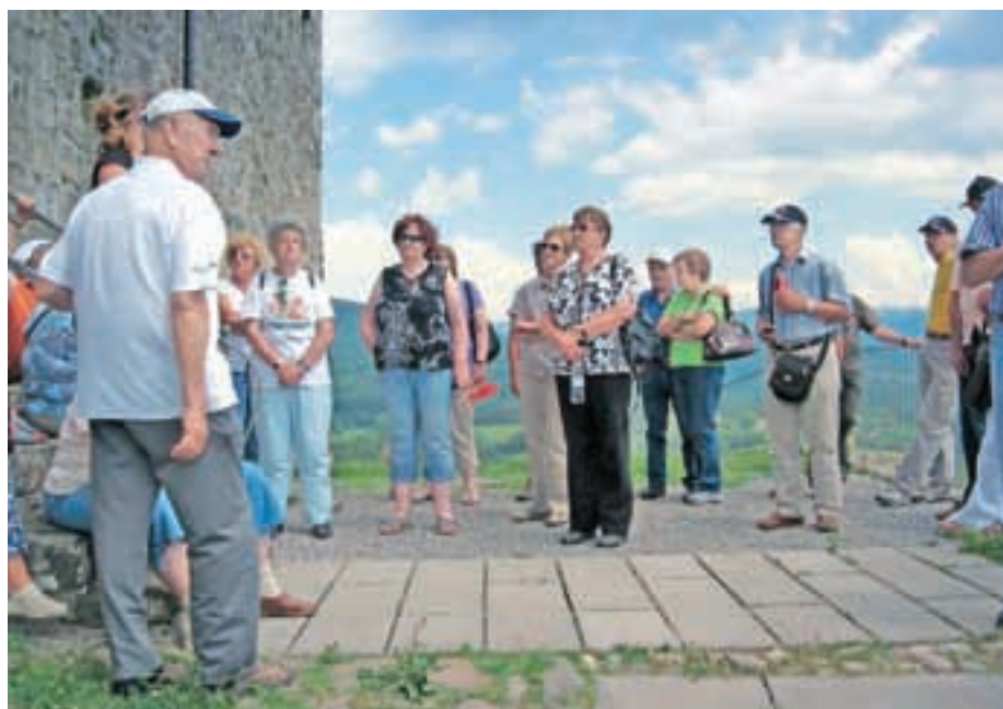
Z izleta na Kras

Spomladi smo spoznavali Kras. Zapeljali smo se v Pivko, se malo razgledali po majhnem, urejenem mestu, nato pa nadaljevali vožnjo do kraja Kal. Tam smo si ogledali Šobčevo domačijo. Obiskal nas je Martin Krpan in nam pripovedoval o dogodivščinah na svojih poteh. Ogledali smo si tudi Ekomuzej pivških presihajočih jezer v Slovenski vasi. Zvedeli smo, da je vseh presihajočih jezer 17, največji sta Palško in Petelinjsko jezero. Poleti, ko ni vode, so tam prelepi travniki. Nazadnje smo si ogledali še kraj in grad Prem ter Kettejevo spominsko sobo. Kraj Prem leži na hribu. Na severnem koncu vasi stoji grad, na južnem pa cerkev svete Helene. Grad je bil zgrajen v 12. stoletju. Med vojno je bil izropan. Sedaj je lepo obnovljen. Večina hiš je starejših. Zgrajene so v tipični primorski arhitekturi, iz kamna. V središču vasi je stara šola, kjer je spominska soba pesnika Dragotina Ketteja. V začetku septembra smo se zapeljali