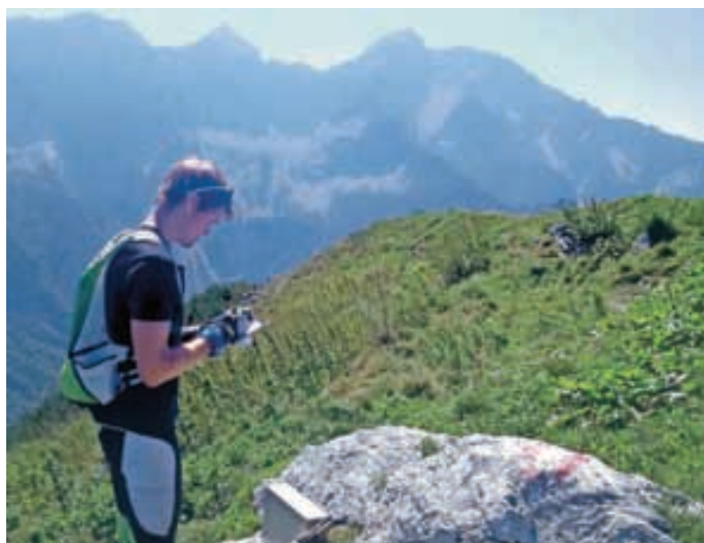
Po jezerskih vrhovih

Vedno bolj se zavedamo, da je za naše zdravje pomembno gibanje, zato se tudi na Jezerskem vse več ljudi odloča, da del svojega časa namenijo človeku najbolj naravnemu gibanju – teku. Zato smo lani v organizaciji športnega in planinskega društva prvič organizirali kros občine Jezersko. Letošnje leto pa smo začeto delo v smeri razvoja teka želeli še nadgraditi. Začeli smo s tedenskimi skupinskimi teki, organizirali in se udeležili teka do Češke koč ter odšli na tekaško preizkušnjo k sosedom na Vrbsko jezero. V oktobru pa se kar 13 tekačev odpravlja na 21- oziroma 42-kilometersko preizkušnjo na Ljubljanski maraton. Občinski kros je bil letos organiziran v sklopu športne sobote. Ves dan smo na športnem igrišču igrali nogomet, odbojko, namizni tenis, izvedli drugi občinski kros in se vmes tudi dobro okrepčali. Kljub slabemu vremenu se je dogodka udeležilo veliko Jezerjanov. Naj se na tem mestu zahvalim vsem, ki so pomagali pri organizaciji naštetih dogodkov, še posebej pa Občini Jezersko, ki je dogodek tudi finančno podprla. Vsekakor se ponovno vidimo naslednje leto na še bolj športni soboti s še več dejavnostmi, kjer bo vsak lahko našel kakšno zase.