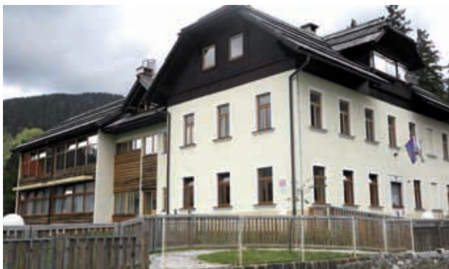
V šolski stavbi so obnovljena okna.

menjana v letu 2008) ter v pritličju večstanovanjske stavbe Korotan, ki je v lasti občine. Vsa zamenjana okna so bila stara in so predstavljala velik toplotni most in energijsko ter posledično finančno izgubo. Vsa okna so lesena, iz sibirskega macesna, zastekljena s troslojno termopan zasteklitvijo, montirana v skladu z RAL-standardom. V šoli smo zamenjali tudi police ob novih oknih, ki so v učilnicah kamnite, v ostalih prostorih pa lesene. Investicija je stala 120.000 evrov, Švicarska konfederacija bo sofinancirala 68 odstotkov sredstev.