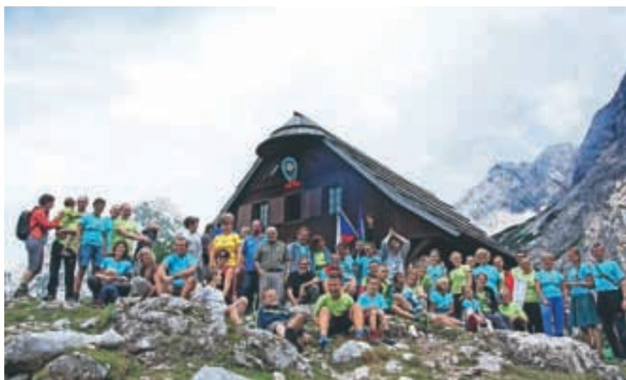
Ob Češki koči

Ob 115-letnici Češke koče je več kot 70 prostovoljcev in prostovoljk pomagalo, da smo skozi praznični julij ljudi z dogodkom za dogodkom spomnili, da je to najstarejša originalna planinska koča v Sloveniji, ki še vedno predstavlja planinsko zatočišče izpred časa novodobnih hotelov.